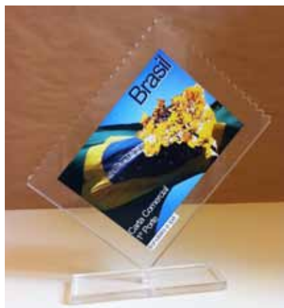
Prêmio de Classe