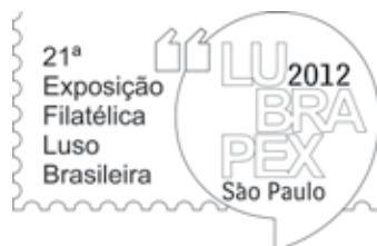
A Força da Língua Portuguesa Correios - São Paulo - SP 10 a 18.11.2012