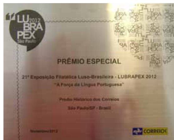
Prêmio Especial Correios