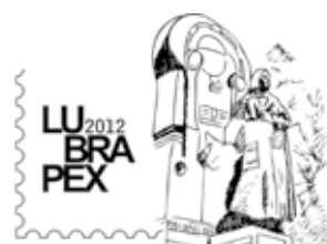
90 Anos - Monumento a Bartolomeu de Gusmão e da 1ª Travessia Aérea do Atlântico Sul Correios - Santos - SP 14 a 18.11.2012