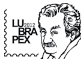
A Força da Língua Portuguesa – Jorge Amado 1º Dia de Circulação Correios - São Paulo - SP 10.11.2012