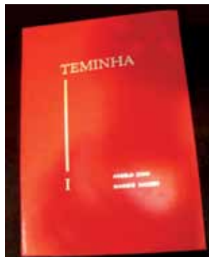
Prêmio Sociedade Filatélica de Americana