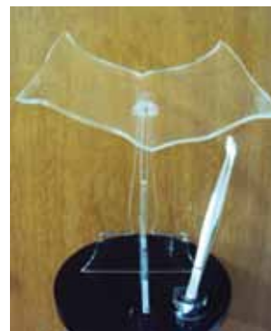
Prêmio Mauricio Melo Meneses