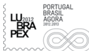
Ano de Portugal no Brasil e do Brasil em Portugal Correios - São Paulo - SP 10 a 18.11.2012